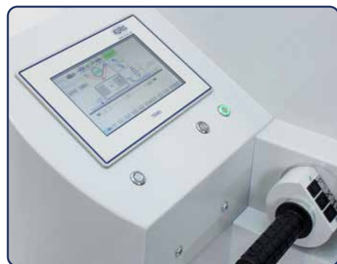
Painel com tela de toque e interface gráfica de fácil e rápida operação

A Enfestadeira A55 é ideal para materiais de difícil estendimento, planos ou mesmos materiais que estejam com rolos de tecidos em estado crítico de processamento, com uma extensa gama de diferentes bases. O novo sistema de rolo para abertura dos materiais e seu berço impulsionado por correias independentes fornecem uma excelente qualidade final nos enfeustos. Os excelentes resultados adquiridos são arquivados automaticamente com todos os detalhes executados. Excelentes resultados no enfeusto são alcançados mesmo com materiais mais sensíveis a tensão. A especificação do material regulado com precisão pode ser ajustada com precisão para a velocidade de estendimento necessária. O carregamento/Descarregamento do tecido totalmente automático reduz consideravelmente o tempo de setup. Muitas etapas do enfeusto com diferentes pontos de posicionamento e corte, número de folhas, programas de enfeusto em Zigue-Zague, bem como vários outros parâmetros específicos dos materiais, podem ser programados individualmente.