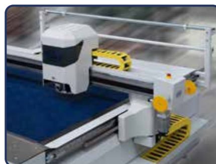
Proteção segura para os cabos de conexão