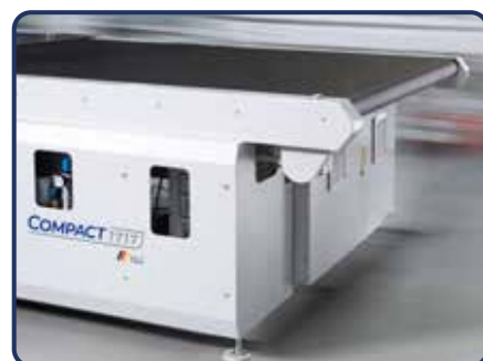
Espaço amplo na área de descarte para retirada dos blocos cortados.