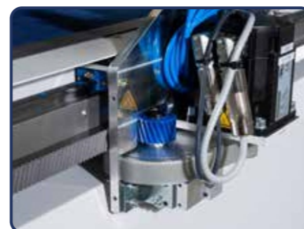
Engrenagens - Livre de manutenção