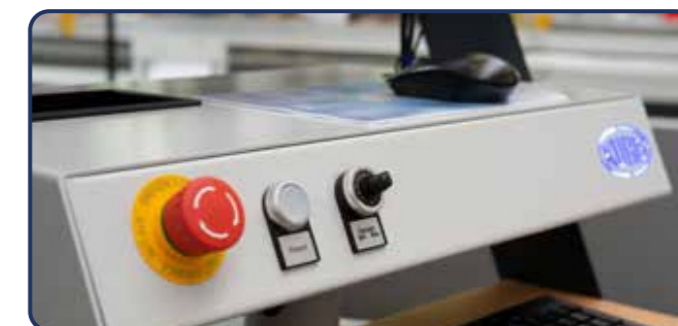
Novo painel com luzes indicadoras e tela de toque